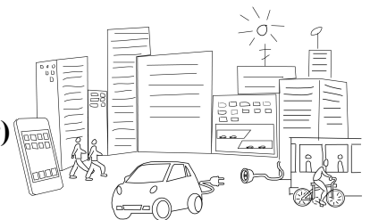
Graphik: © Dr. A. Sgobb